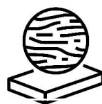
Vată minerală bazaltică