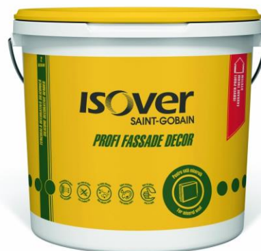
Găleată 25 kg